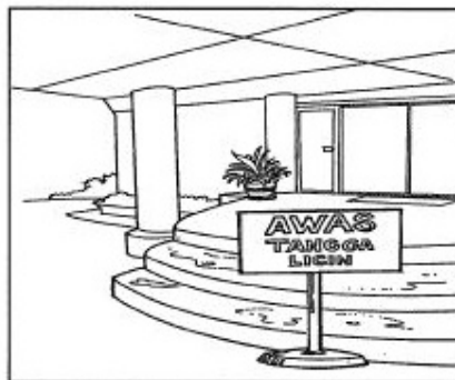
Papan Tanda Amaran

Calon perlu menghuraikan ciri-ciri sekolah selamat. Ciri-ciri tersebut berdasarkan maklumat yang diberikan dalam soalan, iaitu khidmat pengawal keselamatan, alat pemadam api dan papan tanda amaran. Ketiga-tiga idea tersebut perlu dihuraikan dengan jelas dan matang, disertakan dengan contoh yang sesuai.